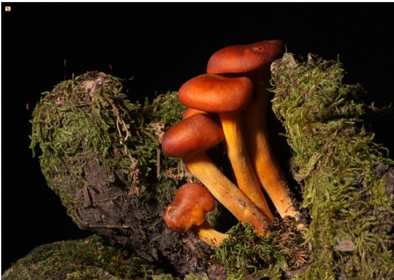
Autore: Antonello Chiaramida

DIREZIONE, REDAZIONE E AMMINISTRAZIONE: Presidenza della Regione – Viale Trento 69 09123 CAGLIARI Tel. 070 6061 – Sito Internet: http://buras.regione.sardegna.it/ – e-mail: pres.buras@regione.sardegna.it